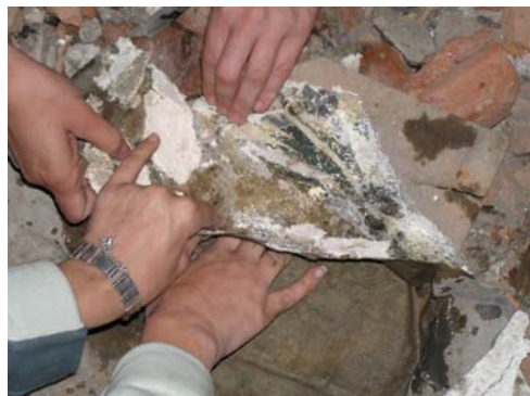
תמונה מס' 12: הסדינים שהודבקו לצורך עבודת הרסטורציה והסרתם

השכבה התחתונה בעלת אופי מדוייק וצבעים חיים וחזקים (צהוב, ירוק, אדום, כתום וכחול) ואילו השכבה העליונה הייתה עשויה ביד חופשית וצירור מהיר בצבעי כחול שחור ואפור וניכר כי השתמשו במכחול עבה במיוחד.