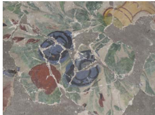
תמונה מס' 13: דוגמאה מהשכבה הישנה יותר והמאוחרת

תהליך זה דומה מאוד לתהליך שזיהינו במסגד ביראקלי ג'מיה, אשר נחשף על ידי צוות רסטורטורים בניהול אדריכל מושאנוב בשנות ה-60.