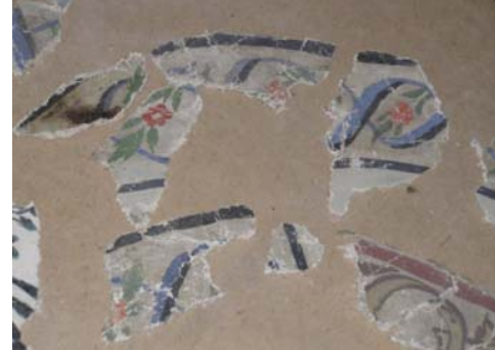
תמונה מס' 6: תשליבים דקורטיביים