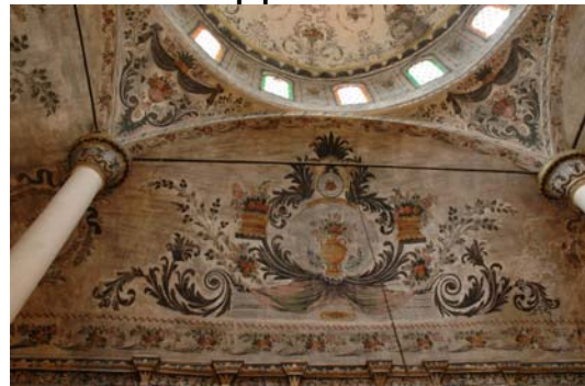
תמונה מס' 9: איורי פנים וחוץ, מסגד ביירקלי

השלב הבא בעבודתינו היה לגלות את סימני הכד. באחת הפיסות התגלתה לבסוף פיית כד והבנו שיש לחפש את גוף הכלי. בנסיון למצוא את גוף הכלי גילינו עוד סימני כד, הפעם כחול. המסקנה הייתה כי מדובר בכמה כדים בצבעים שונים.