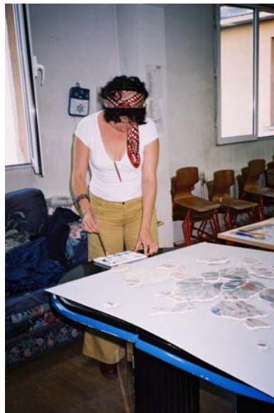
תמונה מס' 16: השלמת התמונה בצבעי מים לאחר הדבקת פיסות הטיח.

השילוב של המאנדריים עם כדי השפע אינו נאמן למציאות – מקומם של המאנדריים היה ככל הנראה בין הקיר לתקרה. (כפי שניתן לראות בבית אריה)