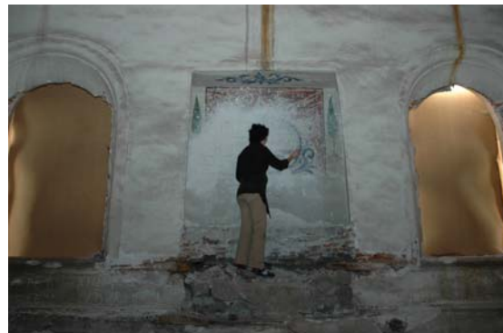
תמונה מס' 3: גומחת ארון הקודש בקיר המזרחי לפני הניקיון ואחריו

מאוחר יותר נאמר לנו על ידי פרופסור אלחנן ריינר כי צמד הברושים מסמלים את ירושלים וזהו מוטיב חוזר ונשנה בציורי קיר בגומחות ארון הקודש בבתי הכנסת באזו.