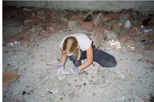
תמונה מס' 4: מיון ראשוני של הפיסות

הטיח היה עשוי מסיד מעורבב בגסות עם חול וקש וניתן היה לחוש בחלקי הקש ובאבנים קטנות (טכניקה טיפוסית לאזור הבלקן). ציורי הקיר צוירו בצבעי טמפרה על טיח יבש. (לא פרסקו).