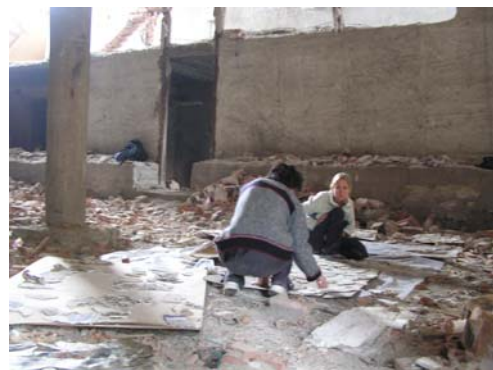
תמונה מס' 5: חלוקת פיסות הטיח לקבוצות על פי צבעים

מתוך בחינה ראשונית של חלקי הטיח חילקנו את הפיסות לשתי קבוצות עיקריות: