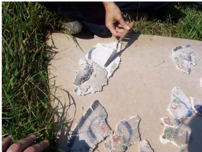
תמונה מס' 11: גילוי שתי שכבות אחת מתחת לשנייה