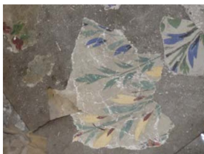
תמונה מס' 7: תיאורים צמחיים