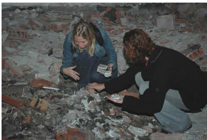
תמונה מס' 2: גילוי פיסות טיח מצויירות

לפתע גילינו, בין ההריסות מבצבצים קטעי צבע. כשהתחלנו לנבור בעפר (שהיה רטוב כתוצאה ממי גשם שחלחלו למבנה), נוכנו לגלות כי מדובר בחלקי טיח.