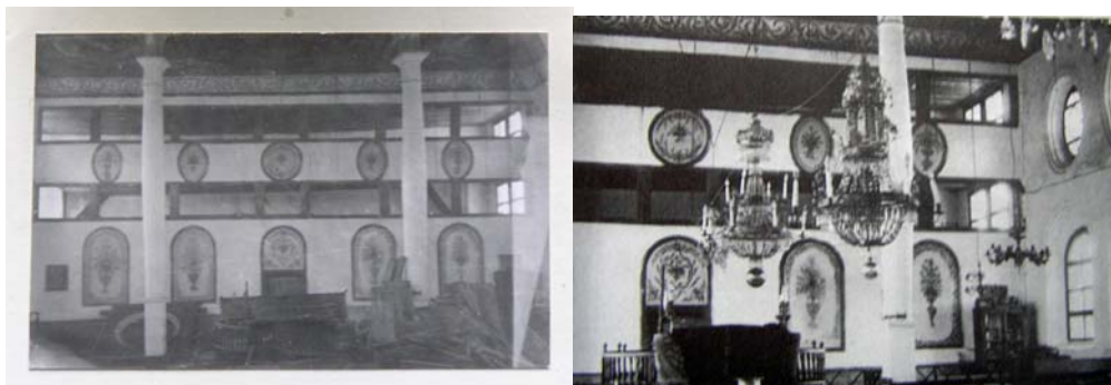
תמונה מס' 15: תמונות בית הכנסת מימים טובים יותר

כל העת המשכנו לחפש צילומים או עדויות על פנים בית הכנסת על מנת לנסות ולהבין איך נראו ציורי הקיר. הישועה נמצאה במשרד הבולגרי לשימור אתרים בסופיה. תמונה קטנה ומטושטשת בה נראה פנים בית הכנסת ובו ניתן לזהות את קיר עזרת הנשים בעלת שתי הקומות, המעוטר כולו בצורות אובליות ועגולות אשר במרכז כל אחת מהן כד שפע.