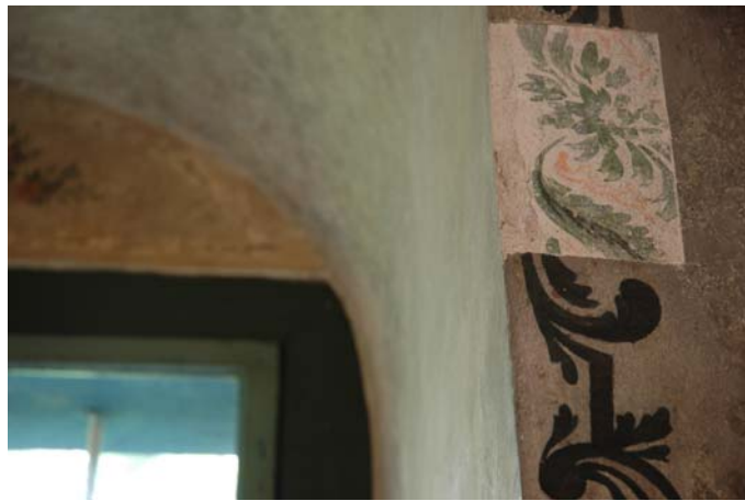
תמונה מס' 14: ציור בשולי חלון במסגד שנחשף בעבודות רסטורציה ומתחתיו שכבת ציור קדומה יותר

בתהליך זה נחשפה שכבה מוקדמת יותר של ציורי קיר אשר טויחה ועליה צוירו ציורים חדשים.