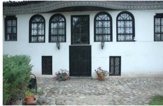
תמונה מס' 8: בית אריה הקטן שנמצא במתחם בית הכנסת