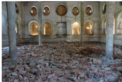
תמונה מס' 1: פנים בית הכנסת וחוץ

לפתע גילינו, בין ההריסות מבצבצים קטעי צבע. כשהתחלנו לנבור בעפר (שהיה רטוב כתוצאה ממי גשם שחלחלו למבנה), נוכנו לגלות כי מדובר בחלקי טיח.