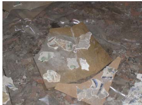
תמונה מס' 10: נסיונות לבניית גופי הכדים

במקביל לעבודת הרכבת הפאזל המייגעת והמיאשת שמנו לב כי בחלל בית הכנסת מגובבים סדינים מטונפים שעליהם סימני רישום דומים מאוד לציורי הקיר. עליהם היו פיסות טיח. שיערנו כי אלה הם שרידים מעבודות רסטורציה שנערכו במקום. לאחר בירור עקשני עם גורמי עירייה שונים קיבלנו הסבר מהאדריכל וסיל קיטוף כי בשנות השישים המאוחרות, הרבה לאחר נטישת הקהילה היהודית את סמוקוב, החליטה עיריית סמוקוב להסב את המבנה המונומנטלי לחלל מוזיאלי. כחלק מעבודות שיקום המבנה נערכו במקום עבודות רסטורציה שאת שרידהן מצאנו באיורים על גבי הסדינים. בשלהי העבודה הוצת המבנה, ככל הנראה בידי תושבי המקום שלא אהבו את היוזמה.